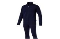
КОСТЮМ ТРЕНИРОВОЧНЫЙ ТРИКОТАЖНЫЙ