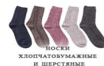
НОСКИ ХЛОПЧАТУМАЖНЫЕ И ШЕРСТЯНЫЕ