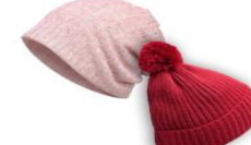
ШАПОЧКА ЛЕТНЯЯ И ТЕПЛАЯ