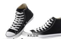
КЕДЫ НА 1—2 РАЗМЕРА БОЛЬШЕ ОБЫЧНОЙ ОБУВИ